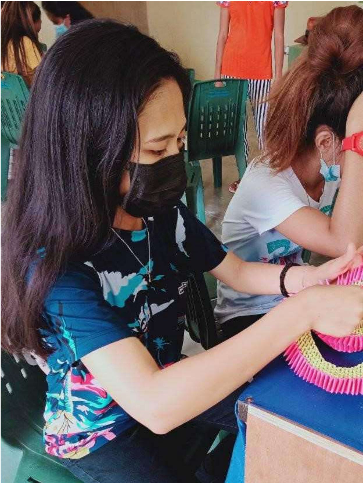
Arbeiten für den Abschluss

BOGOHILFE e.V. Wiederaufbau und nachhaltige Hilfe für ein besseres Leben Möbusstraße 5 55543 Bad Kreuznach