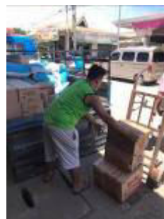
Beladen des LKWs

Die Bevölkerung leidet sehr unter dem Shutdown. Bisher hat die Regierung allen mit Lebensmittel geholfen, wir als Bogohilfe haben uns zurückgehalten. Leider gibt es derzeit keine staatliche Hilfe. So haben wir am Sonntag (5. Juli) beschlossen, den zwei „Gemeinden“ Takdan 1 und Takdan 2, aus denen auch die meisten unserer Schüler kommen und wir uns verantwortlich fühlen, zu helfen. Am Montag haben wir bereits über eine Tonne Reis, Konserven und Tütensuppen für 75.000 PHP (1.400€) kaufen lassen. Am Dienstag und Mittwoch wurde portioniert und an insgesamt 232 Familien verteilt.