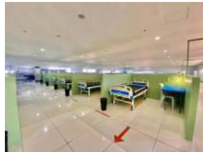
eine temporäre Notfallklinik

Auf den Philippinen werden die Maßnahmen aufgeteilt in GCQ (General Community Quarantine = Allgemeine Gemeinschaftsquarantäne) und ECQ (Enhanced Community Quarantine = verstärkte Gemeinschaftsquarantäne). Eine Einreise ist derzeit nur für philippinische Staatsangehörige möglich, ein Reisen zwischen den Inseln und auf den Inseln ist inzwischen wieder eingeschränkt möglich. Die aktuellen Maßnahmen können immer online abgerufen werden. Auch die Philippinen haben vorgesorgt und sind vorbereitet.