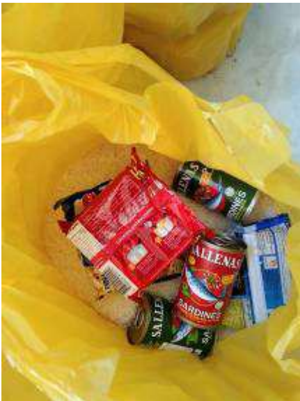
Ca. 3 kg Reis, Sardinen und Suppe