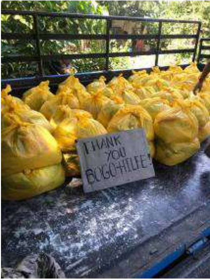
Die Plastiktüten kosten übrigens inzwischen Geld und werden mindestens 20 mal benutzt.