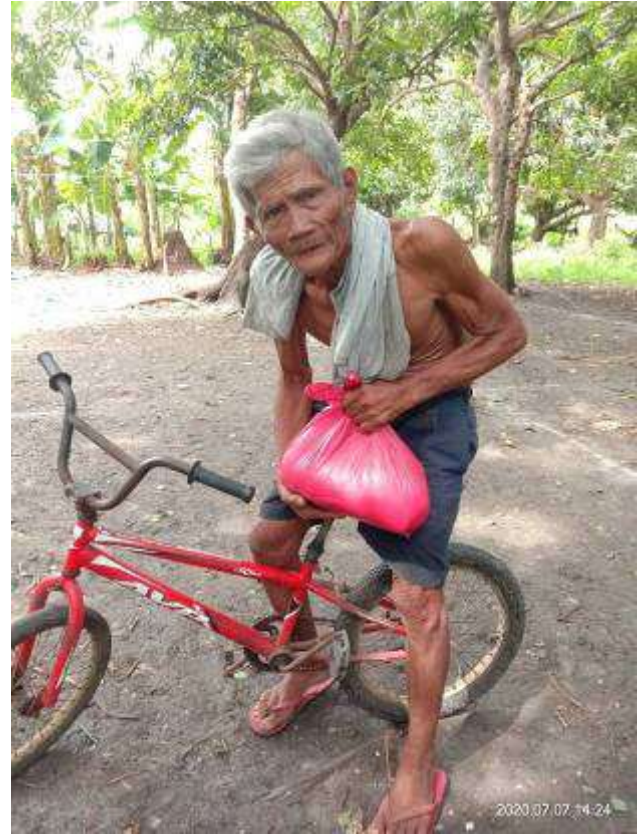
Durchweg nur glückliche Gesichter