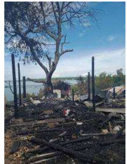
Diese Bilder erreichten uns von dem Brand in Polambato, ausgelöst durch einen Kurzschluss im Stromnetz.