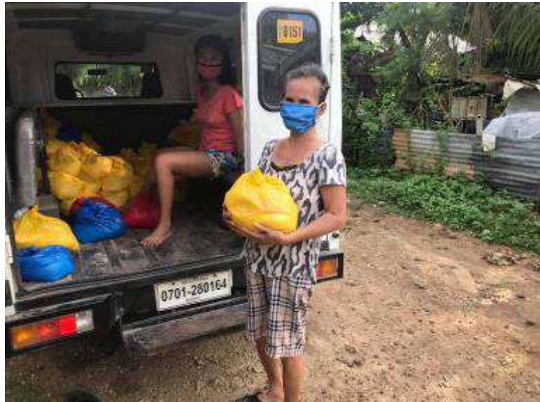
Verteilung der Hilfspakete