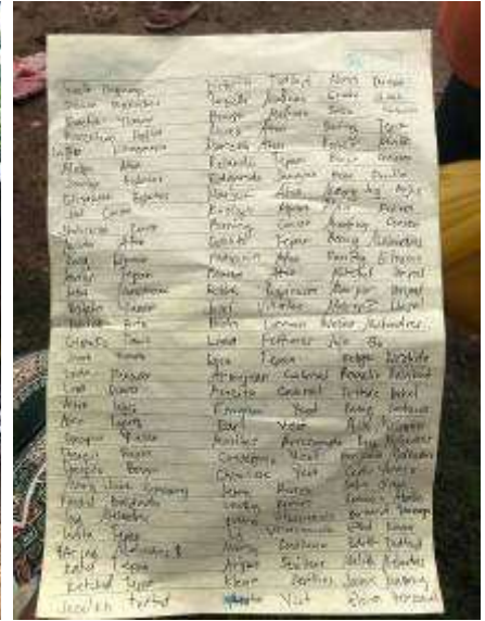
Nach getaner Arbeit