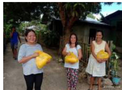
nur glückliche Gesichter

Auf den folgenden Seiten sind noch einige Bilder von einer sehr erfolgreichen Aktion.