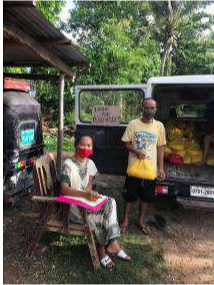
Warten auf den Ansturm